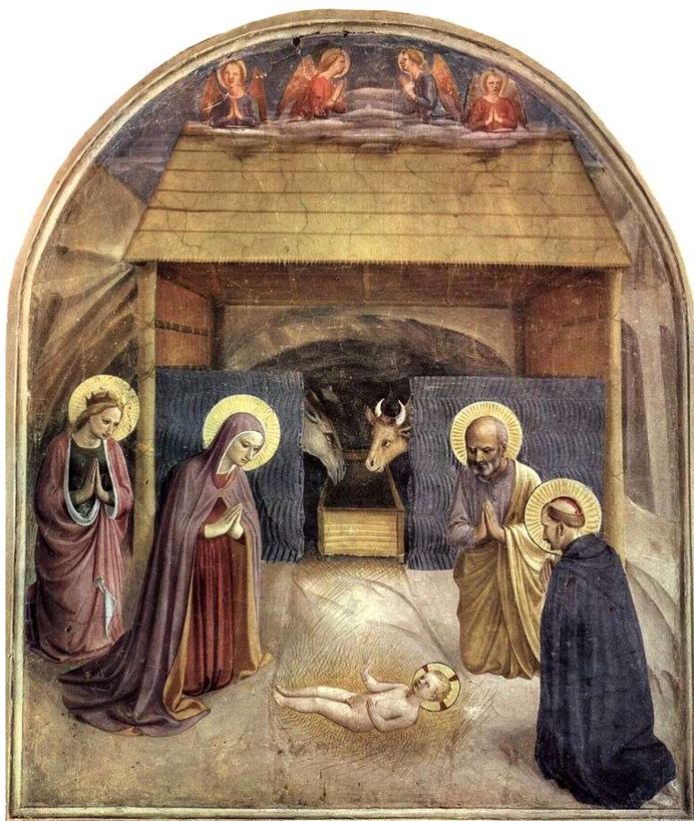
Crèche de Fra Angelico

Ll'écoutét lés anjhes chantàe Ce que l'étét venu faere : (bis) Aportàe la trançhilitai Aus jhents d(e) la boune afaere. ■