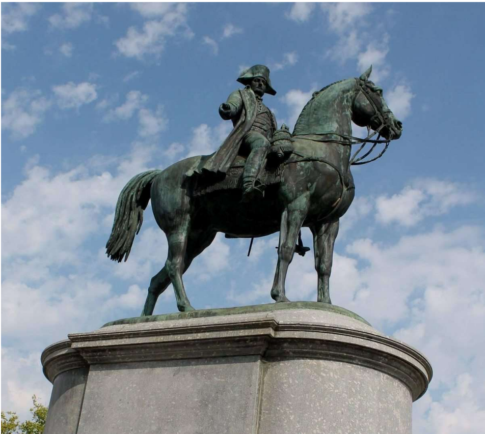
L'éstatue de Napoléyun au mitan de la pllace de La Roche-su-Yun