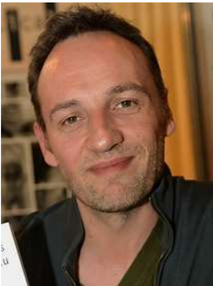
François Bégaudeau, qu'at grafe-gnai çhou roman L'Amour.

J haque aghine Jhane d'adoubàe tot ac daus cornichuns, de menjhà la pea dau soucissun séc, de métre in tee-shirt jhabrous, de pa abriàe sun cacrea a la pllajhe, de maladàe ac ine enrimure putout que de prendre daus antibiotiques, de dire « in espèce de » putout qu'ine espèce, de dire « il mouille » putout qu' « il pleut », de dire « car » putout que « bus », de se mouchàe den dau Sopalin, de se téndre lés méns su lés anchàuds qu'o fét ressortir le bedou, de métre la goralle trop tout su le gralour, de laessàe le chèn rentràe den la begnerie, de patuchàe den le